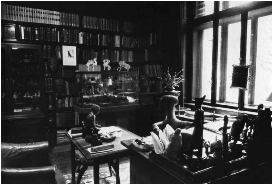
das Arbeitszimmer Sigmund Freuds in der Berggasse 19