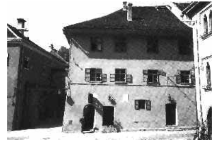
Das angeblich Geburtshaus auf der Schäßburger Burg

eben diesem Ursprungskern zu entdecken und dann vor allem einzugehen. Wenn also eine historische Person zu einem Vampir wird, dann vermischen sich bestehende Folklore und Persönlichkeit. Mehr noch: Folkloristische Eigenschaften werden einer herausragenden Person des historischen Interesses übergestülpt. Schlesak moniert in seinem Buch diese Fehlleitung des Lesers. Siebenbürgen nimmt in der internationalen Wahrnehmung ganz den Charakter eines Geisterlandes ein. Die Hoffnung, daran könne sich etwas ändern, scheint nicht besonders groß, denn gerade die aktuelle Mode der Vampir-Romanze in cinemographischer und literarischer Form bestärkt den Willen, an Vampiren aller Art festzuhalten. Wie könnte da der bekannteste unter ihnen, eben Fürst Dracula, einfach verschwinden? Er muss bleiben, wenn er auch allein steht.