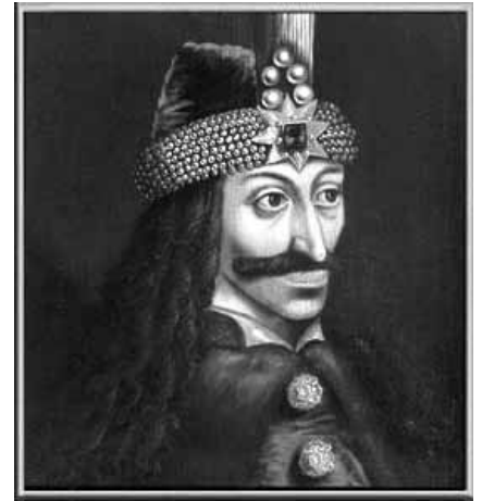
Vlad der Pfähler